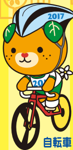
自転車 (ロードレース)